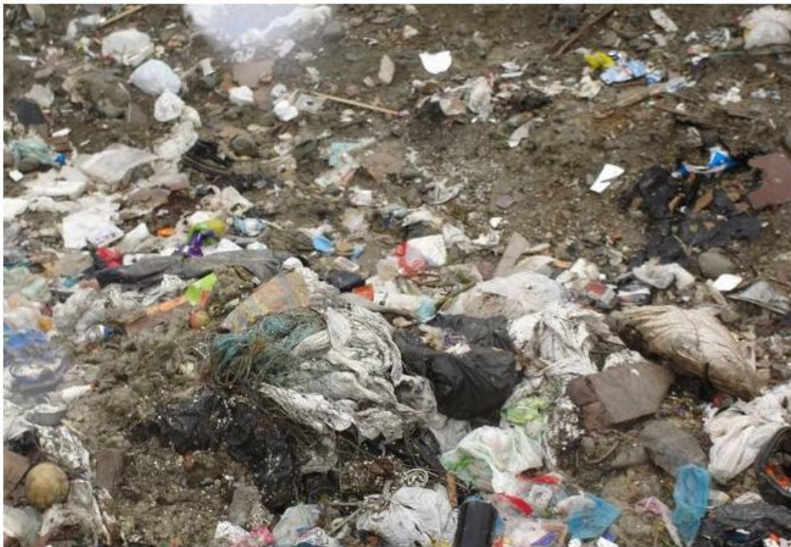
Dépotoir municipal de fabre au printemps 2011